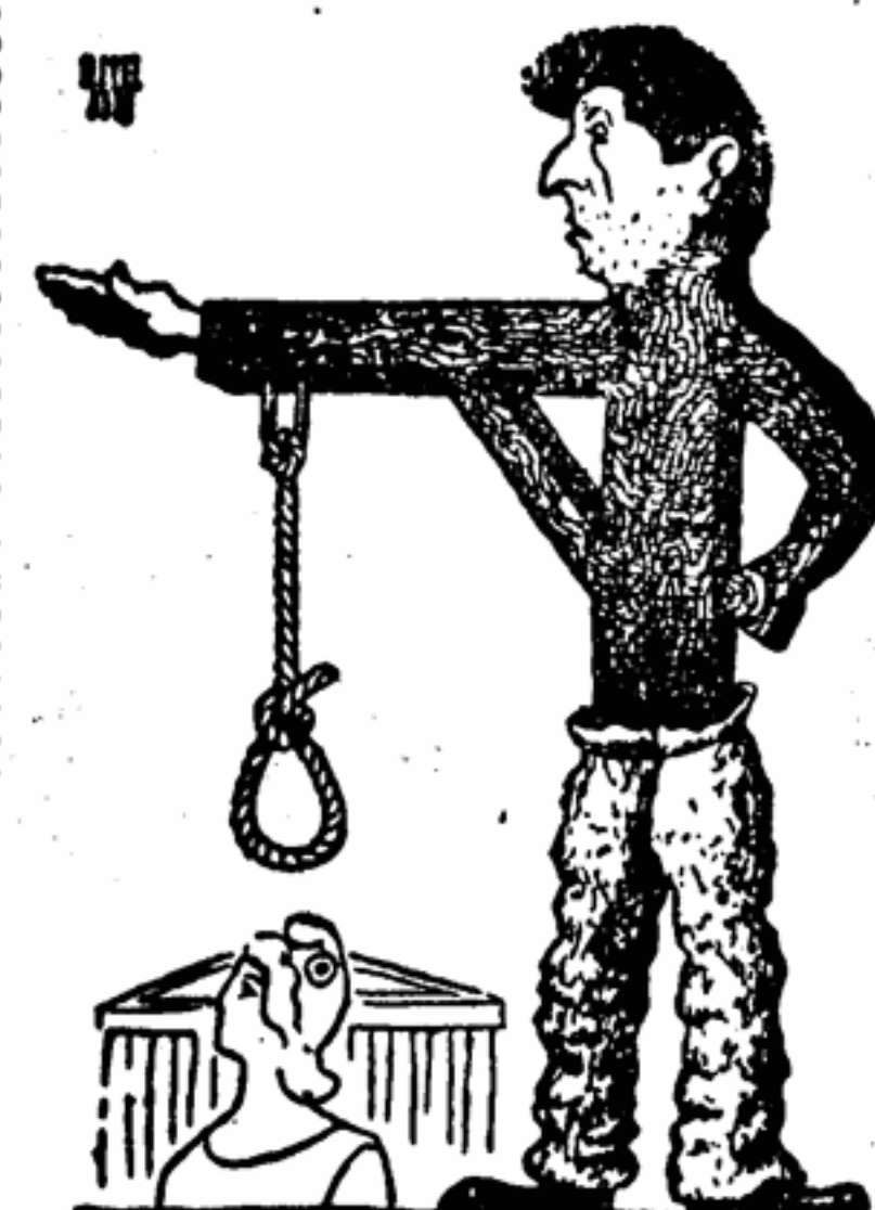
Пужад — Кто сказал, что у меня нет никакой политической программы? Рисунок художника Мителера из французского еженедельника «Л'Унион».

«Франкфуртер рундschau» в той же статье отмечает, что «всеобщая воинская повинность привела бы через несколько лет к созданию насчитывающей миллионы людей резервной армии».